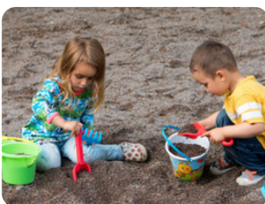
Senzorická herní zóna