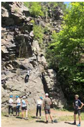
Na výběr jsme měli výstupy různých obtížností