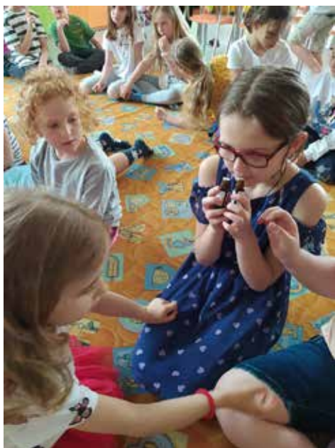
Děti při zkoušení vůní aromatických olejů