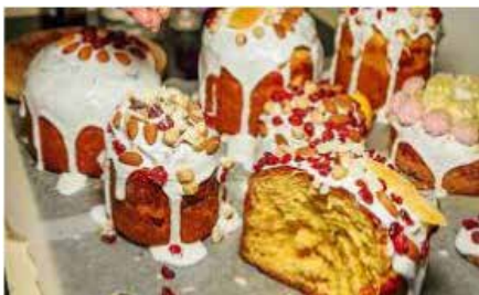
„Syrna paska“, typický ukrajinský velikonocní pokrm

se mazance, které jsou vysoké a nahoře vypouklé, plné rozinek, sušeného ovoce nebo oříšků. Mazanec má polevu a je ozdoben barevnými sladkostmi. Také se dělá „syrna paska“. To je tvarohová pyramidka vyrobená utlačením tvarohu do formy ozdobené křížem nebo písmeny „XB“ (souvisí to se způsobem, jak se o Velikonocích zdraví).