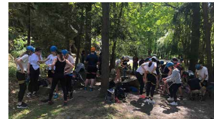
Za chvíli to začne! Navlékáme si sedáky a obouváme lezečky

Jako první jsem si vybral dlouhou trasu nejbliže k přehradě, kterou jsem však nezdolal, proto jsem hledal lehčí alternativu. Tu jsem úspěšně zvládl nahoru i dolů. Na konci