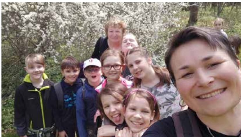
Výlet do přírody