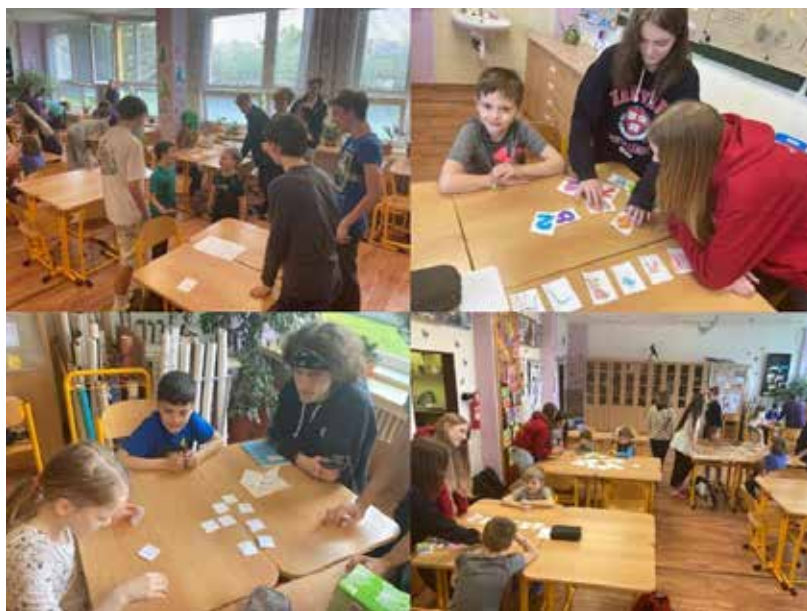
Takhle vypadala naše hodina s prvňáčky

Hodinu jsme začali tím, že jsme si prvňáčky vyzvedli a šli s nimi k nám do třídy. Tam se rozdělili na skupinky po dvou až třech a hurá do akce. Kromě aktivit jsme pro prvňáčky vyrobili kartu, do které se zaznamenávalo, zda dané stanoviště zvládli. Úspěšní byli úplně všichni a paní učitelka Rárová pro ně připravila sladkou odměnu. Na závěr nám ještě prvňáčci zazpívali pěknou písničku jako poděkování.