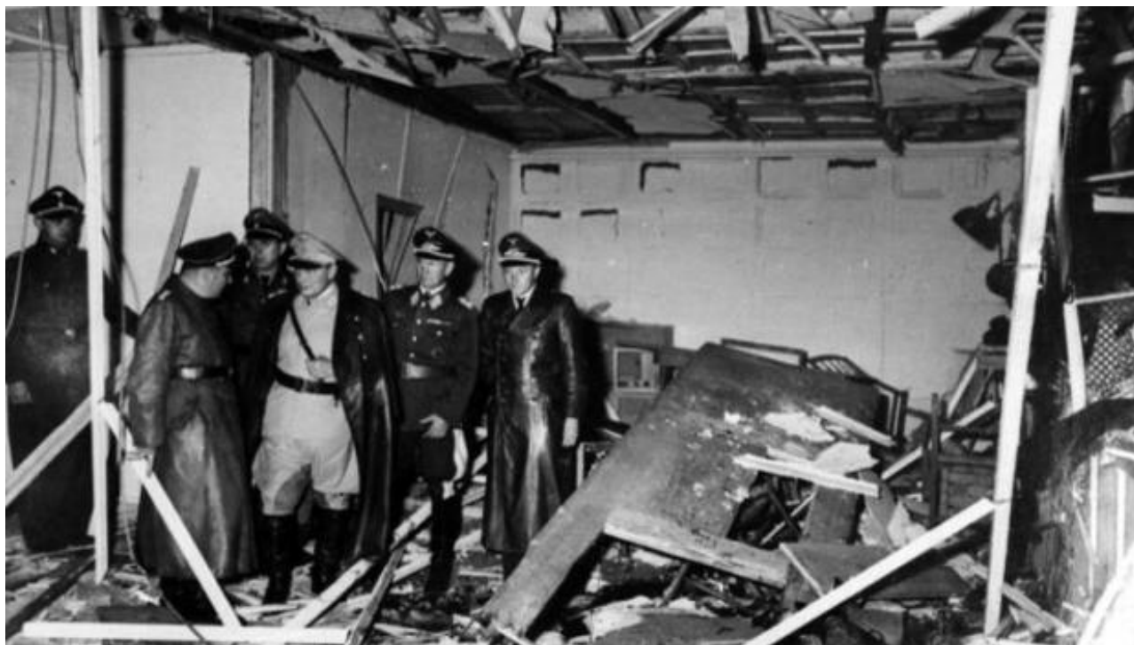
Takto vypadala místnost krátce po výbuchu