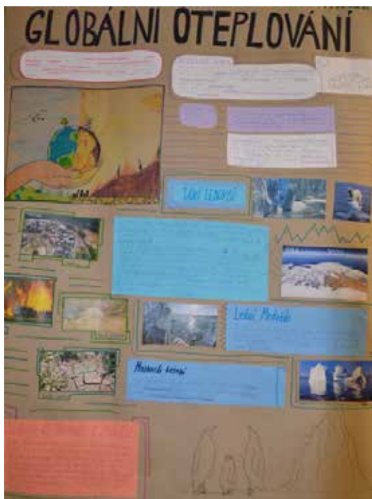
Tématu Globální oteplování se věnovali žáci devátých ročníků