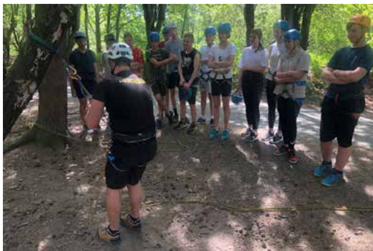
Před lezením jsme absolvovali instruktáž, jak se zapínat a slaňovat