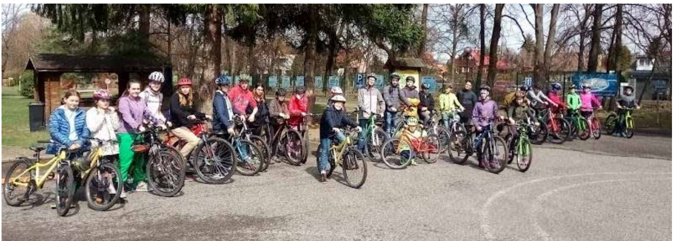
Všichni účastníci školního kola Dopravní soutěže mladých cyklistů