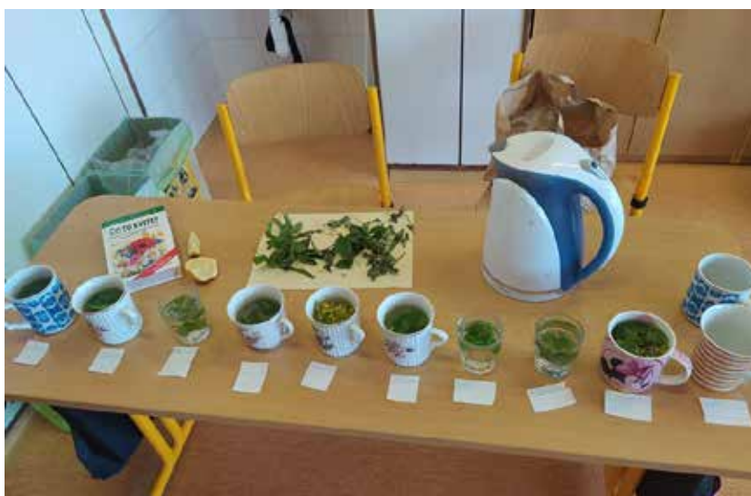
Připravené bylinky