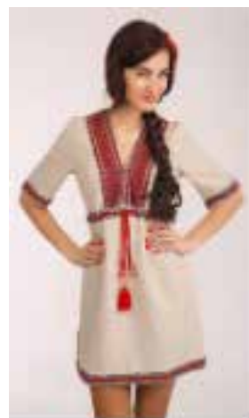
„Vyšyvanka“, tento typ oblečení se často na Ukrajině nosí při slavnostních příležitostech

budovy. Na Ukrajině je velmi pěkná a panenská příroda, kvůli ní stojí za to přijet. V rámci naší kultury jsou zajímavé také nejružnější vyšívané věci, ubrusy nebo oblečení. Jedná se o tzv. „vyšyvanku“, druh oblečení, na kterém se křížkovým stehem vyšívají různé vzory typické pro Ukrajinu. V poslední době se začínají tyto typické znaky na oblečení více propagovat a prosazovat, stává se zvykem tyto vyšyvanky (moderně střižené) nosit při svátečních příležitostech. Jinak pokud bych měla říct, na co nalákat turisty na Ukrajinu – na přírodu, pohostinné a přátelské lidi a na výborné jídlo.