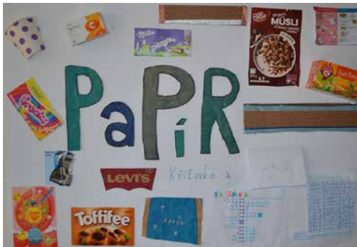
Na papírové a další obaly se zaměřili žáci šestých ročníků a vytvořili takovéto krásné projekty