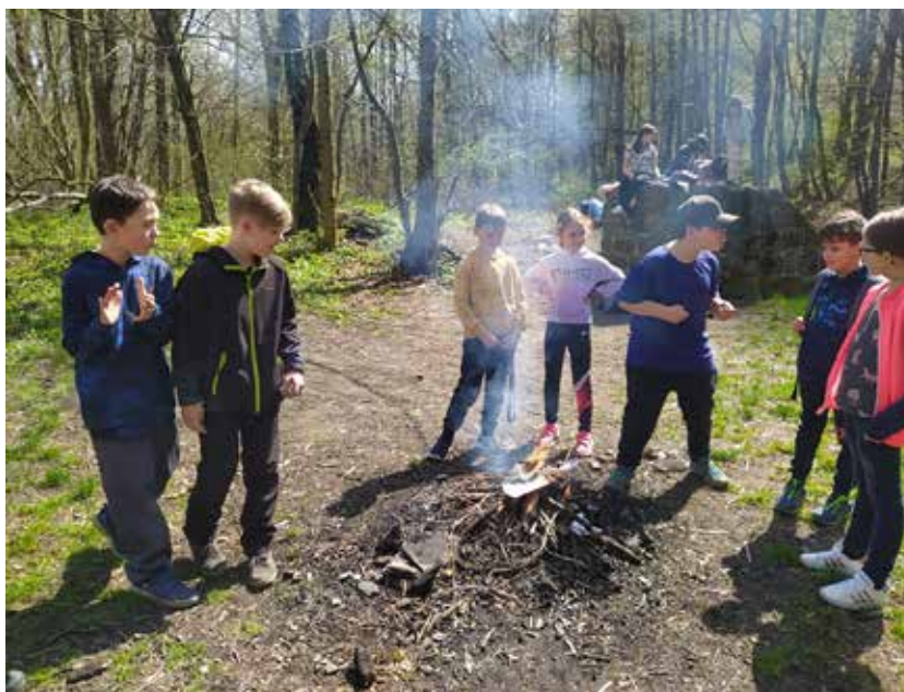
Udělali jsme si i oheň