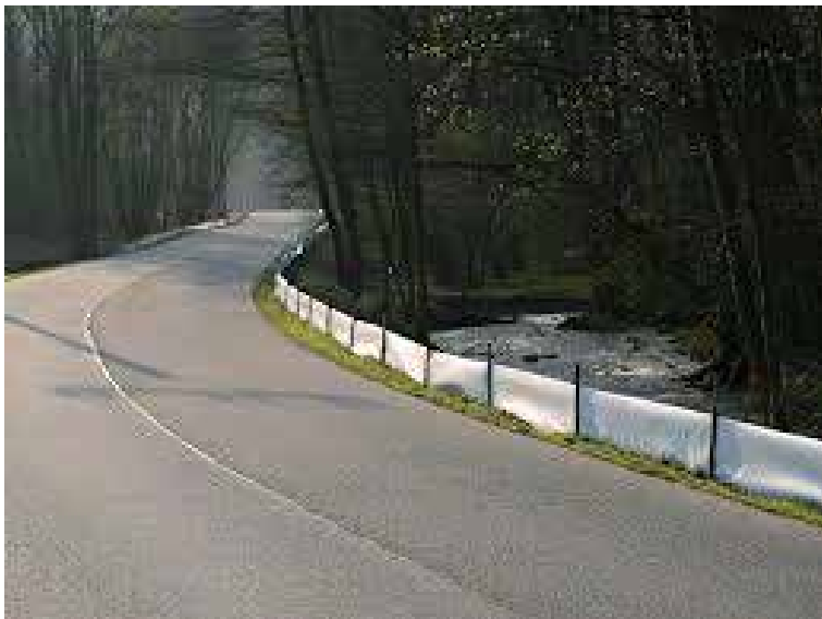
Speciální igelitové zábrany podél silnic zachrání tisíce žab