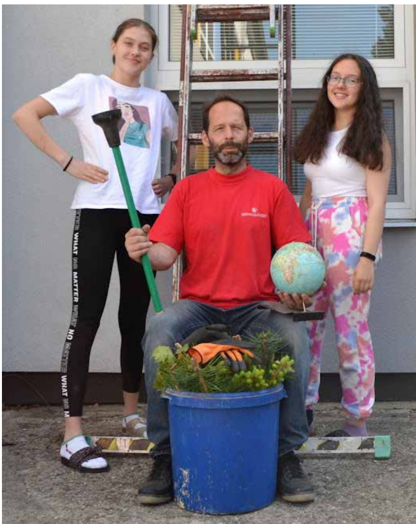
Naše redaktorky vyrušily pana školníka při práci

Čtu strašně rád. Kdybych měl víc času, tak čtu pořád. Nemám žádný vyhraněný žánr, tak jak v hudbě nemám něco vyhraněného. Prostě mám rád dobrou literaturu a dobrou hudbu. Třeba Hrabala mám rád, toho bych mohl číst pořád.