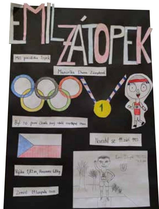
Kolektivní práce 9. ročníků v hodinách výtvarné výchovy