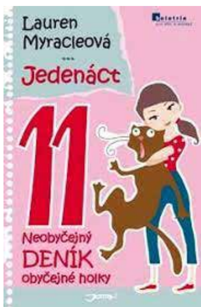
Ilustrační foto | Google Images

Literární sérii Lauren Myracleové s názvem Jedenáct - Neobyčejný deník obyčejné holky doporučuji zejména dívkám.