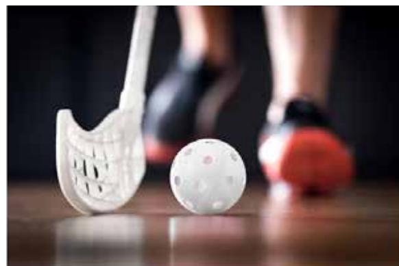
Ilustrační foto | Pixabay

Jedná se o zájmovou činnost, ve které žáci 7.C nejen čtou, ale také pečou, hrají hry a plní různé únikovky. Kroužek probíhá