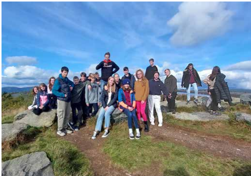
Exkurze se nám líbila a i počasí se vydařilo!

Poté jsme autobusem jeli asi půl hodiny k vodní elektrárně Dlouhé stráně. U ní jsme se nejprve dozvěděli informace o samotném fungování elektrárny a zhlédli dvě krátká videa. Prohlédli jsme si taky jednu z vystavených turbín.