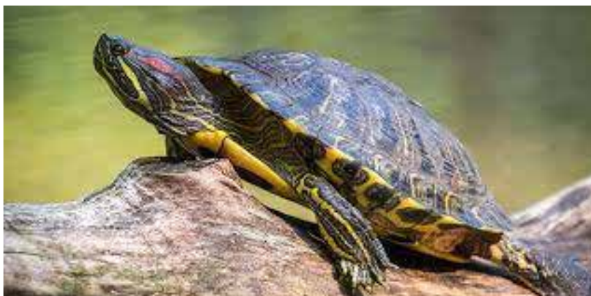
Ilustrační foto | Google Images

Lehce podobný příběh má také želva nádherná. V této době existuje spousta dětí, které mají doma jako prvního domácího mazlíčka právě toto zvíře. Nezřídka se stává, že želva svého majitele omrzí. Roste totiž, musí se jí častěji měnit voda a také toho více sežere. Rodinná rada rozhodne, že milou želvu vypustí do přehrady či rybníku, kde si želva sice žije