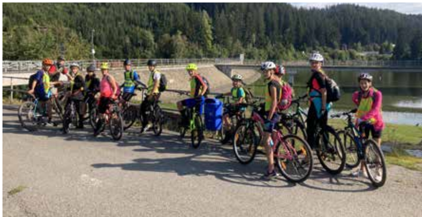
Přehrada na Horní Bečvě, už jsme skoro v cíli!

Po jídle jsme vyšlapali kopec Pinduli a přes Ráztoku dojezdili do Trojanovic. Poslední naší zastávkou byl stánek u místní zmrzliny a pak jsme úspěšně dojezdili do cíle ke škole, kde na nás již čekali rodiče, aby nám posbírali