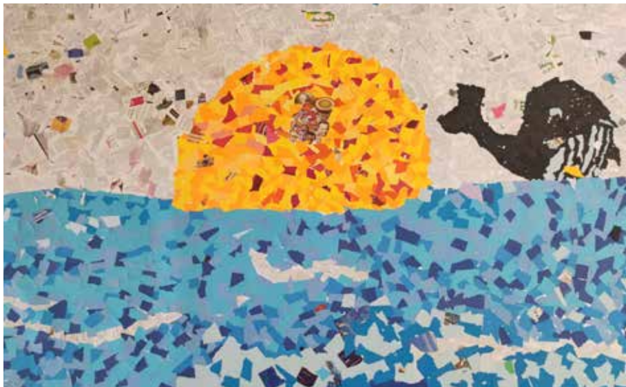
Mozaika | Kolektivní práce 9.B