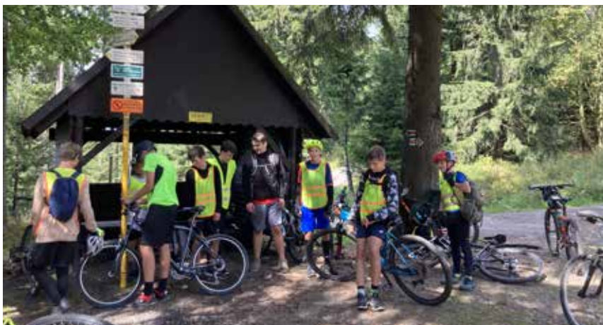
Krátká zastávka v průběhu cesty

batohy, a my se mohli vydat ke svým domovům.