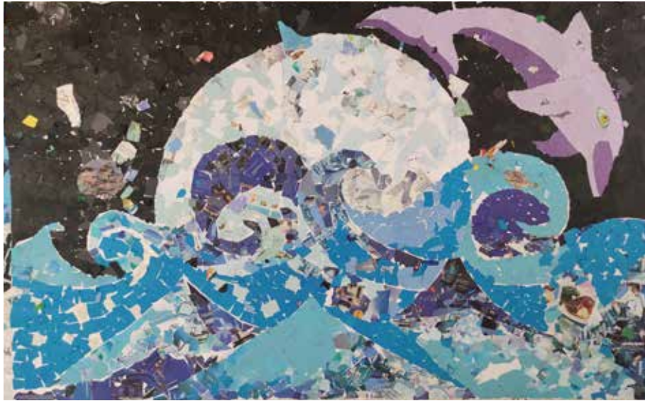
Mozaika | Kolektivní práce 9.A