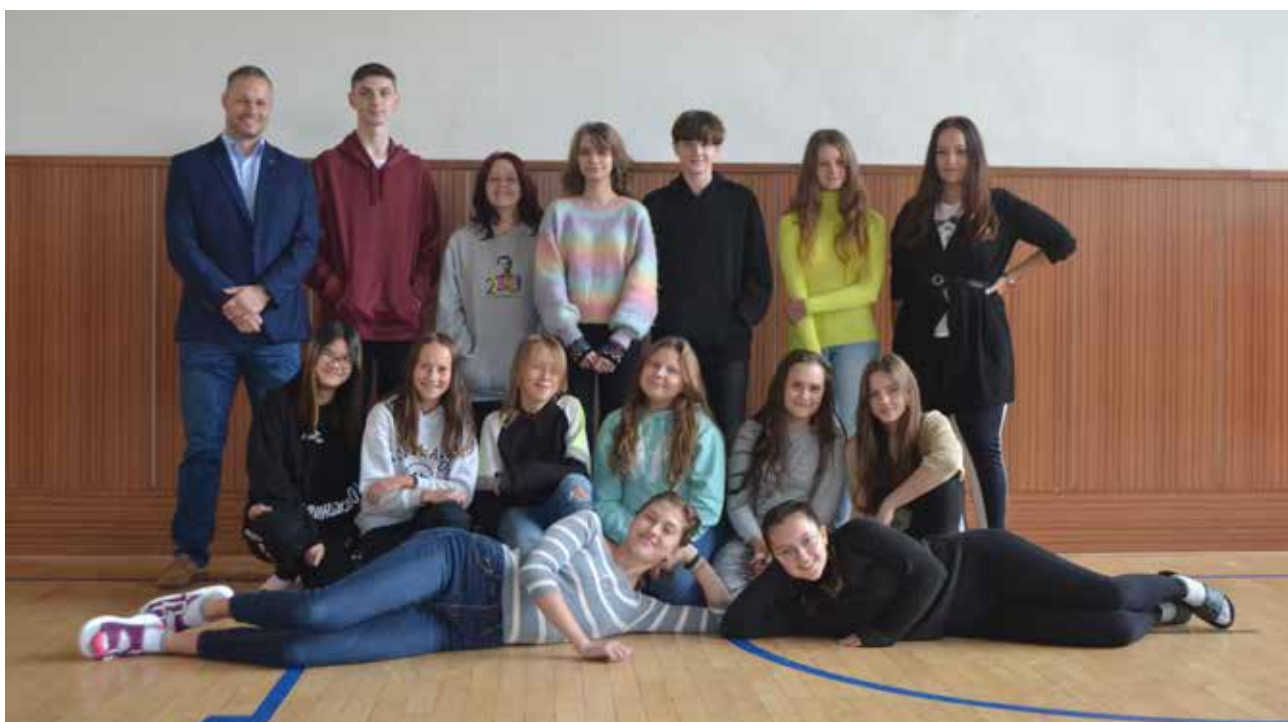
Členové Redaktorského kroužku