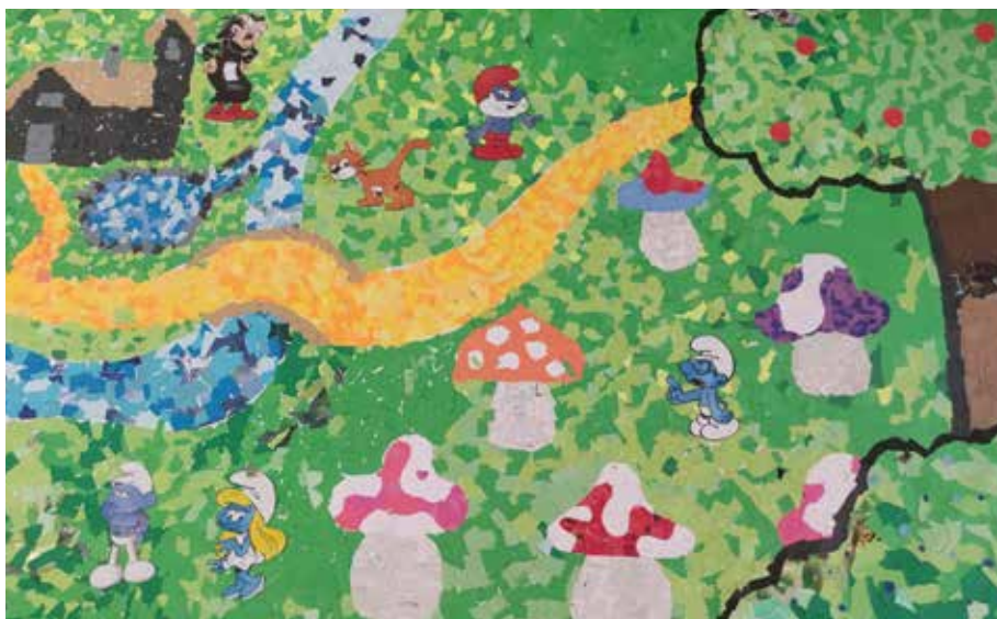
Mozaika | Kolektivní práce 9.C