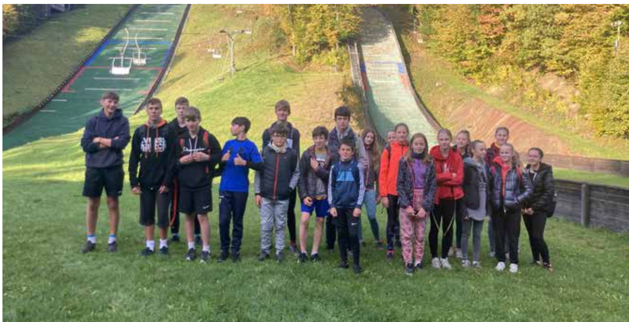
Naše běžecké naděje chystající se na závody na Horečkách