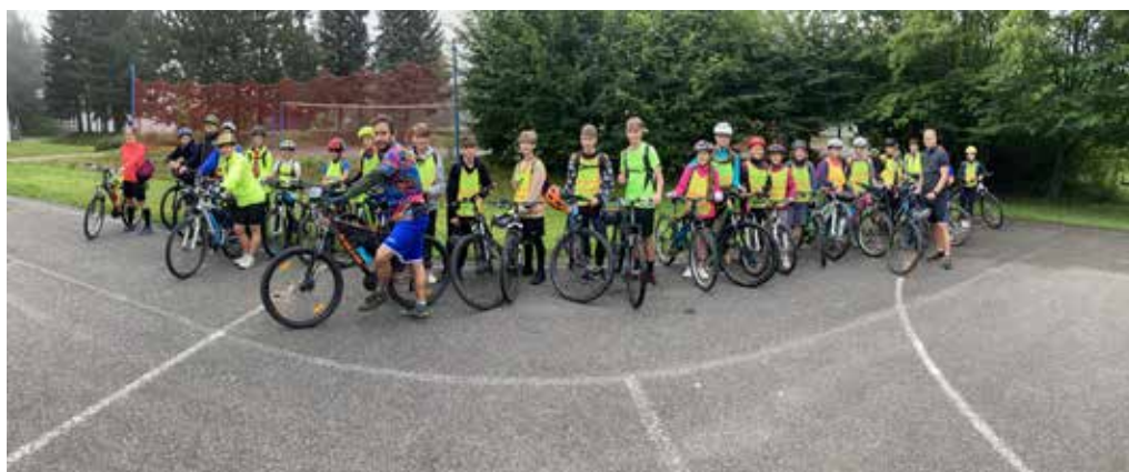
Cyklistický kurz nám právě začíná, takto jsme byli seřazeni na startu!