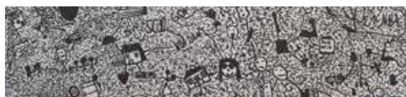
Vojtěch Pešák, IX.B