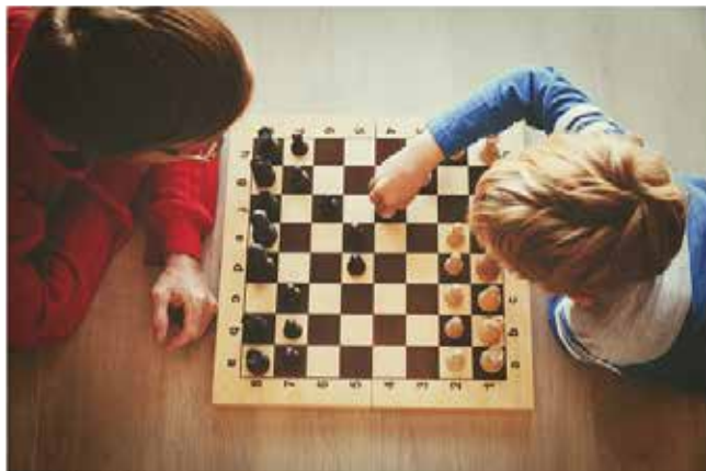
Ilustrační foto | Pixabay

Kroužek je určen žákům od 1. do 9. třídy. Cílem této královské hry je, aby si děti osvojily základní pravidla a strategie šachu a současně, aby k této hře získaly kladný vztah a dobře se u ní pobavily. Prostřednictvím výuky si děti trénují pozornost,